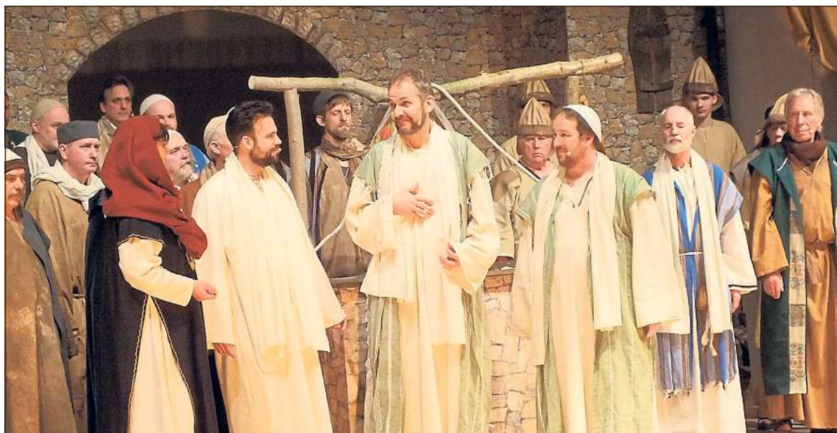
Eindrucksvoll schon bei der Generalprobe: Paulus und sein Gefolge treffen auf eine gläubige, jüdische Tuchhändlerin.